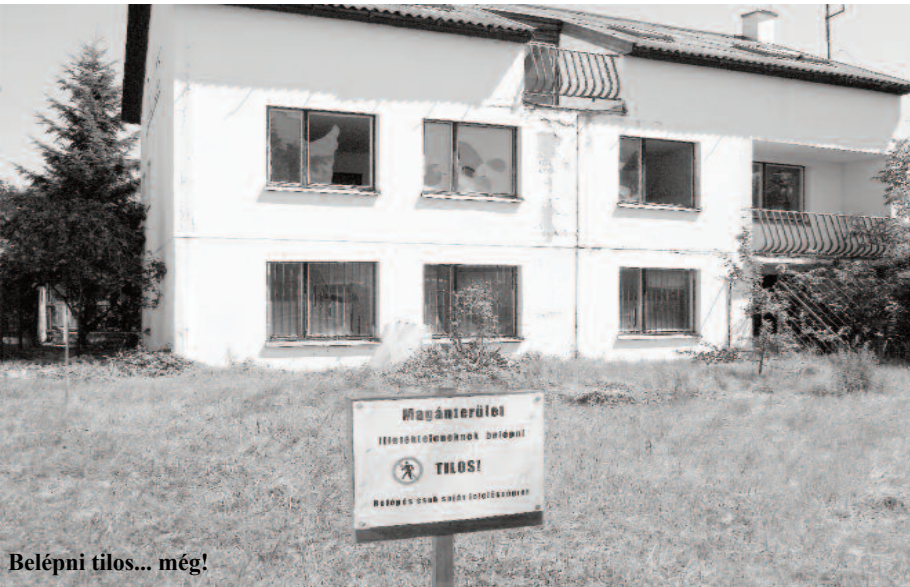
Belépni tilos... még!