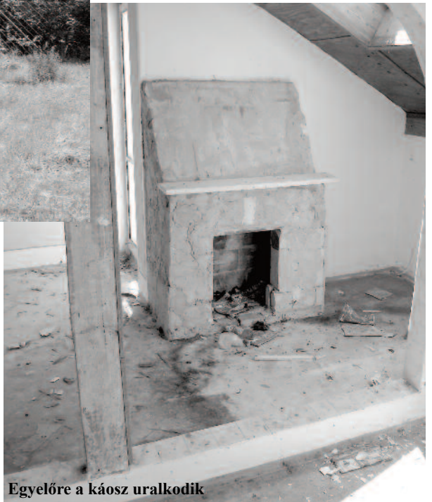
Egyelőre a káosz uralkodik

konkrét elképzelést még ne mondjam el. Dolgozom már rajta, de még nem szeretném előre elárulni. Amint eljön az ideje, mindenki megtudja majd, milyen munkálatok zajlanak ott. Annyit mondhatok, hogy fontos az elképzelésben az, hogy ez egy új szint visz majd a község életébe és helyieknek legalább 3-5 munkahelyet is teremt majd.